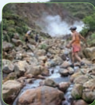
Le catamaran est une base pour effectuer des randonnées de rêve.

Enfin, à noter que de nouveaux catamarans font leur entrée dans la flotte, dont deux Lagoon 440 en Grèce, un Lagoon 500 en Croatie avec skipper obligatoire, équipé de climatisation, TV-DVD home cinéma, dessalinisateur 95l/heure, micro-ondes, lave vaisselle, lave-linge/sèche linge... et un Léopard 400 en Croatie - Informations : www.ventportant.com