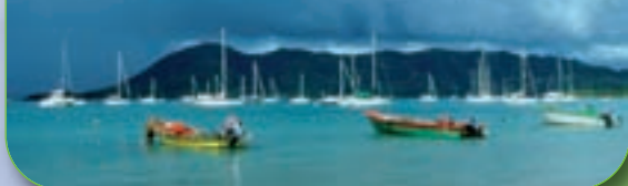
Le mouillage à Portsmouth.