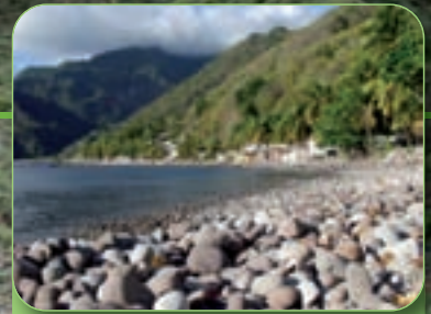
Les plages de la Dominique... Sauvages et isolées !

La Dominique, un paradis pour les randonneurs.